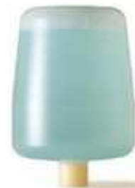
CR-USO8/4SM 400 ml Cartouche Suprême Mousse