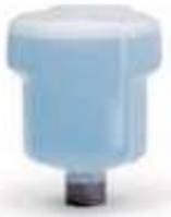
CR-5001/CSA 500 ml Confort Bleu