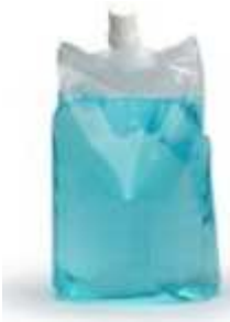
CS-5003/CSA 1000 ml Confort Bleu