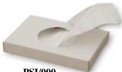
PSI/000 Recharge 25 sacs