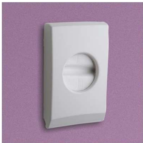
3060/OOB ABS Capacité : 1 sachet de 25 sacs