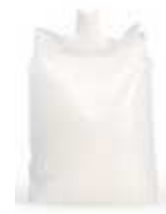
CS-5001/SSA 500 ml Suprême Blanc