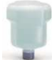
CR-5001/SIN 500 ml Sintex Vert Antibactérien