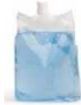
CS-5001/CSA 500 ml Confort Bleu