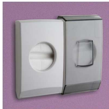
3070/OOB ABS Capacité : 2 x 25 sacs