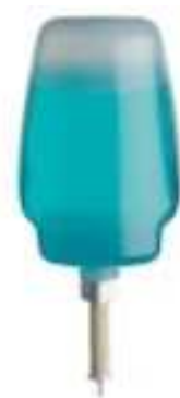
CTS-5003/CSA 1000 ml Cartouche Confort Bleu