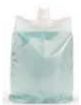
CS-5001/SIN 500 ml Sintex Vert Antibactérien