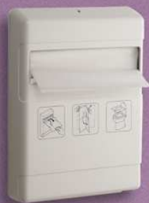
4039/NOB Distributeur de couvre siège Capacité : 1 boîte Sécurisé avec clé