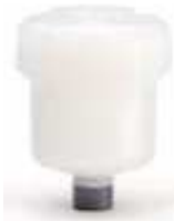
CR-5005/SSA 500ml Suprême Blanc