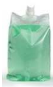
CS-5003/SIN 1000 ml Sintex Vert Antibactérien