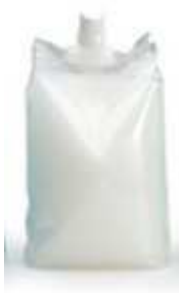
CS-5003/SSA 1000 ml Suprême Blanc