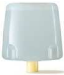
CR-USO8/8SM 800 ml Cartouche Suprême Mousse